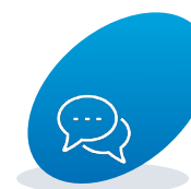
Spremni smo za saradnju